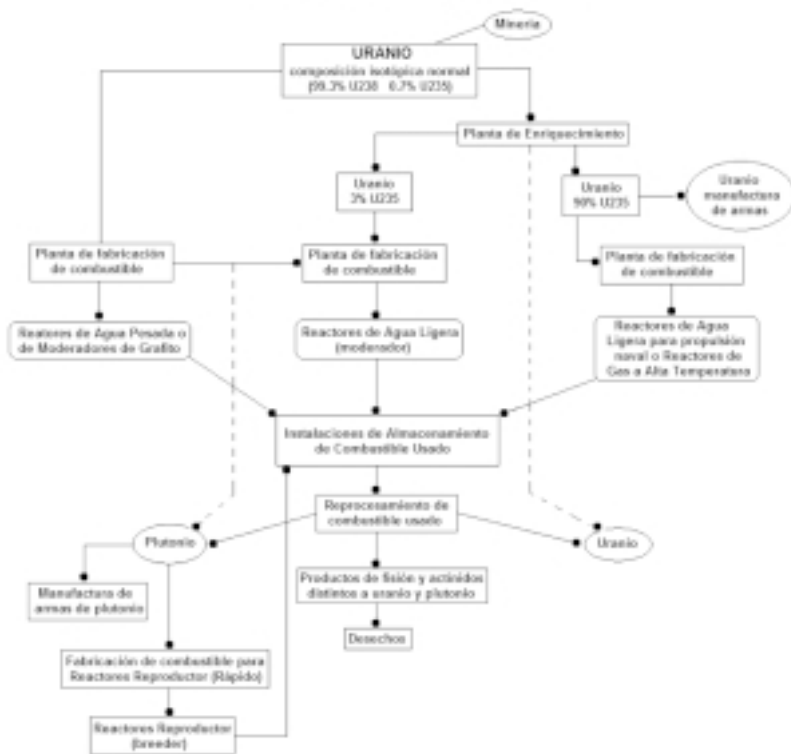
IMAGEN 1 Ciclo del Combustible Nuclear

Otros diseños de repositorios de desechos nucleares con problemáticas similares se proponen en Oskarshamn y Östhammar en Suecia; en Haute-Marine, Francia; en Eurajoki, Finlandia; en Karnataka, India; en Gansu (cerca de Mongolia), China; y en otras localidades de Reino Unido y Japón (Brumfiel, 2006: 987; David, 2002).